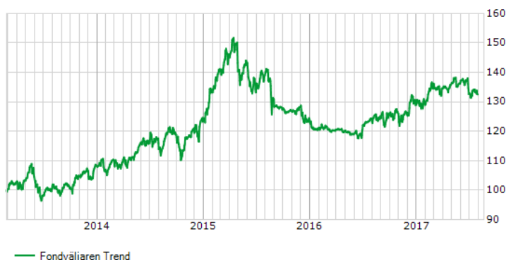
Historik för Fondväljaren Trend sedan fondstart.