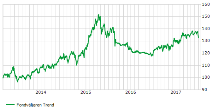
Historik för Fondväljaren Trend sedan fondstart.