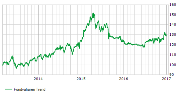
Historik för Fondväljaren Trend sedan fondstart.